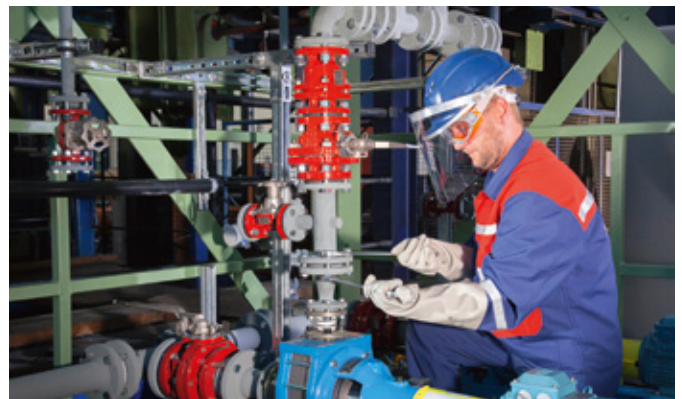
↑ Installation einer DIABON® Graphitpumpe

„Lifecycle Service“, unsere Motto für Services basiert auf den vier Phasen des Lebenszyklus beginnend von der Lieferung und Inbetriebnahme bis zum Ende der aktiven Anwendung. Unser Anspruch ist Ihnen kundenorientierte sowie nachhaltige Lösungen nach dem aktuellen Stand der Technik in allen Phasen bereitzustellen.