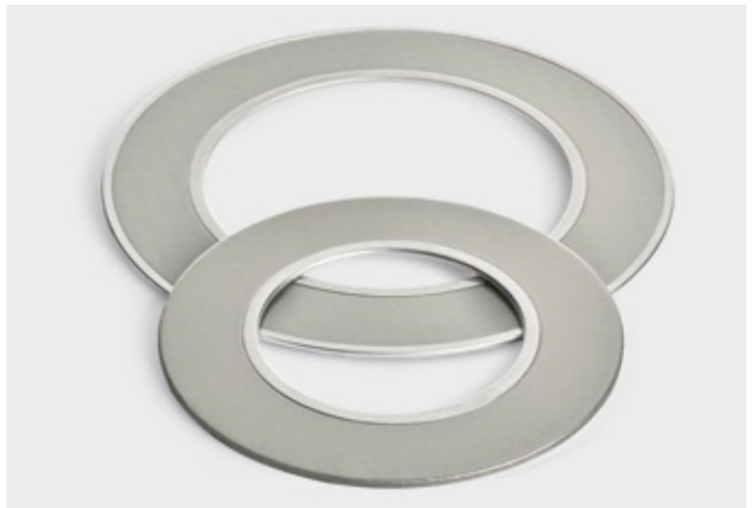
↑ Dichtungen aus SIGRAFLEX MF