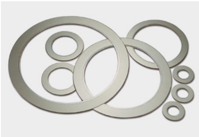
↑ Dichtungen aus SIGRAFLEX MF