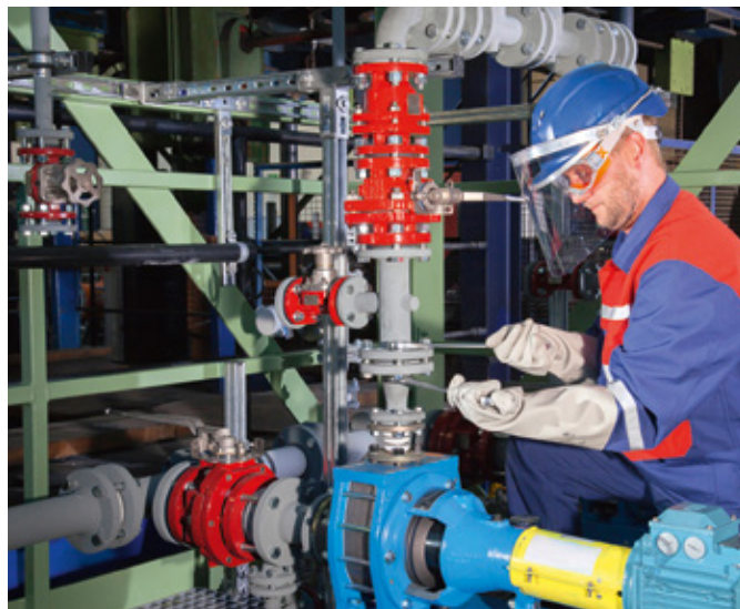
↑ Установка графитового насоса DIABON®

«Lifecycle Service», наш девиз для услуг, основан на четырех фазах рабочего цикла, начиная от поставки и ввода в эксплуатацию до конца активного применения. Наша цель состоит в том, чтобы предоставить вам ориентированные и устойчивые современные решения на всех этапах.