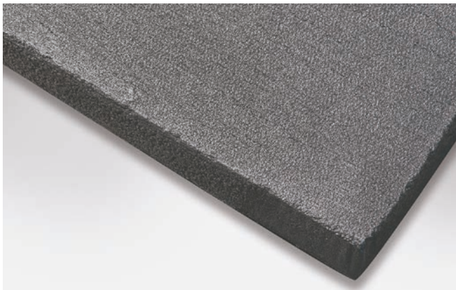
↑ ECOPHIT L Graphitleichtbauplatte

ECOPHIT L Leichtbauplatten sind in unterschiedlichen Abmessungen und Flächengewichten als Plattenware erhältlich. Sie weisen nur geringe Gehalte an Halogenen und Schwefel von jeweils kleiner als 200 ppm auf, um Korrosion durch Verunreinigungen im Graphit möglichst zu vermeiden.