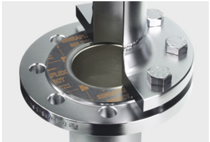
↑ Flansch mit SIGRAFLEX SELECT Flachdichtung