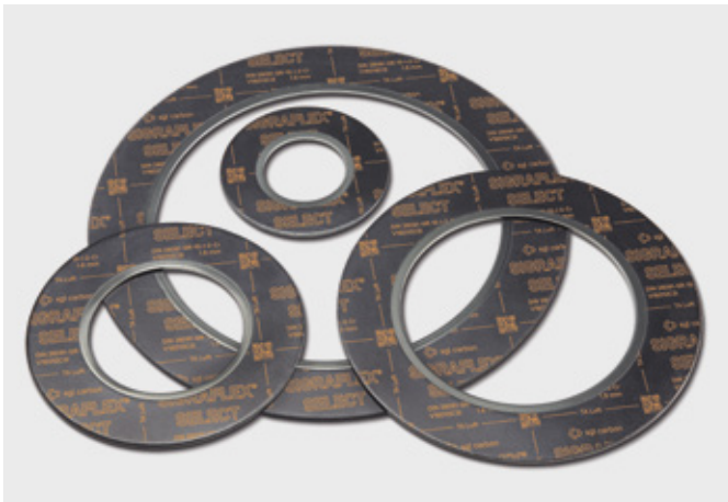
↑ Dichtungen aus SIGRAFLEX SELECT