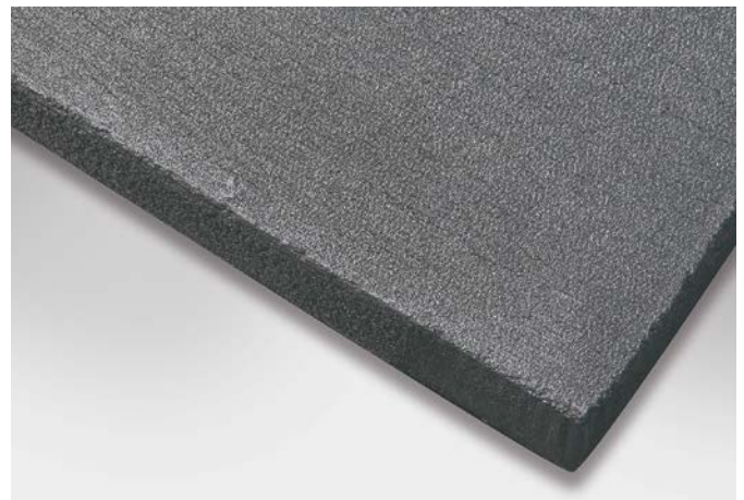
↑ SIGRATHERM L leichte Graphitplatte

Viele Anwendungen im Bereich der Kühlung von Elektronik und Leistungsgliedern oder Anwendungen zur Erhöhung der elektrischen Leitfähigkeit profitieren von den exzellenten Eigenschaften von SIGRATHERM.