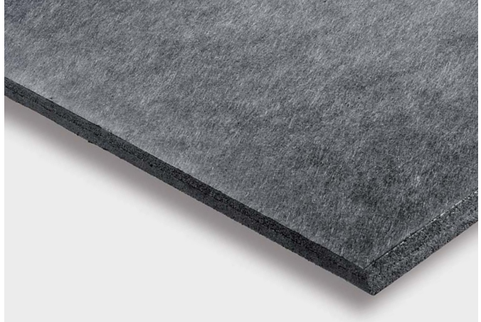
↑ SIGRATHERM LN laminierte leichte Graphitplatte

* bezogen auf den Graphitanteil (ohne Vlies) Weitere Abmessungen und Kombinationen auf Anfrage. Bitte kontaktieren Sie uns.